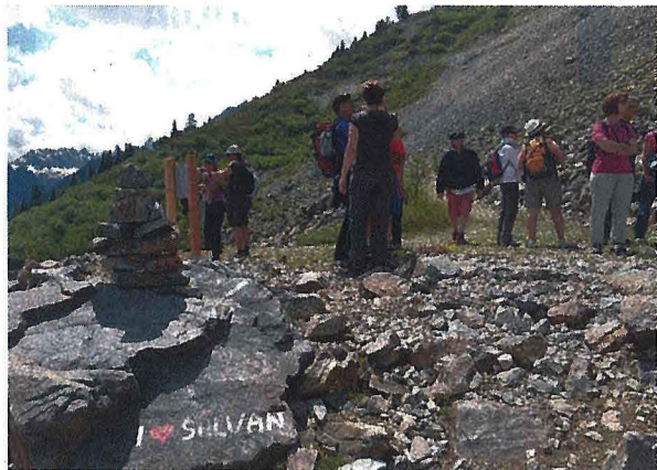
Sur les hauts de Salvan/Les Marécottes, le sentier de La Creusaz aborde la question des dangers naturels.