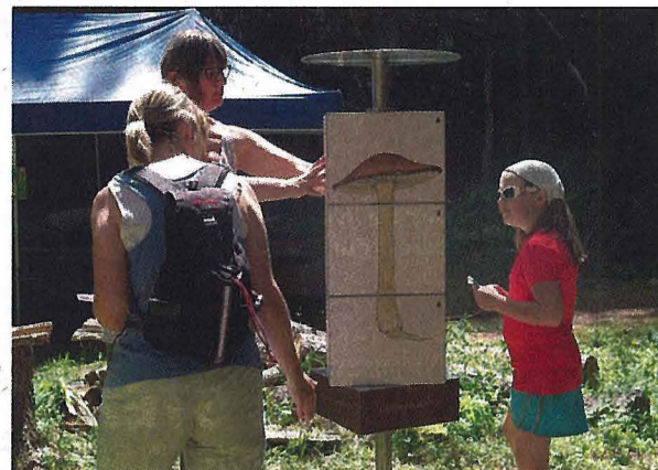
Entre Champex-Lac et Orsières, l'univers des champignons est accessible aux jeunes et aux adultes.