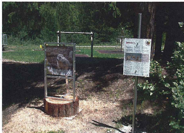
A La Fouly, la faune est à l'honneur, en particulier Charlotte la Marmotte.